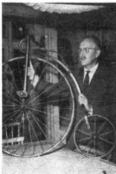
Een belangrijk museumstuk is deze kind-fiets, een kleine ‚hoge bl‘.

bijvoorbeeld het ‚J-Rad‘, de uitvinding van de ingenieur Jaraj. De man ging ervan uit, dat de fietser gemakkelijker dan voorheen moest kunnen fietsen, dus hij construeerde een soort ‚gemakkelijke stoel‘ op wielen, waarbij de fietser achterover leunde en dus minder wind ving dan de gewone fietser. Daarbij construeerde hij een voortbewegingssysteem, waarbij een veer werd opgewonden, die als deze afliep, de fietser een soort ‚duwtje‘ gaf. Wie deze fiets nu ziet, zegt ‚Wat een gek ding‘, maar wie deze tweewieler echt op zijn technische merites onderzoekt, komt tot de conclusie, dat de vinding lang niet gek was.” Al is deze hobby van de heer Arnold alleen maar een aardige