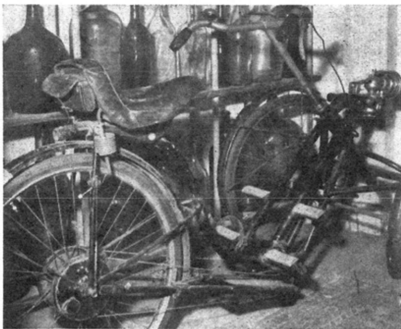
Het driewielige type van het „J-Rad“ is een kolossaal gevaarte, dat vooral opvalt door het gemakkelijke zadel.