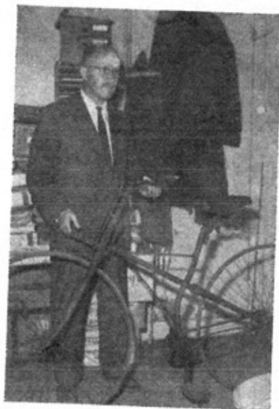
Foto rechts onder: bij de afdeling verpakte onderdelen troffen wij deze liggende achtervork aan, waardoor de as van de cardan-aandrijving loopt. De kettingloze fiets is echter nooit populair geworden.